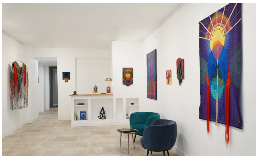
Exposition de Barbara Asei Dantoni

La galerie Art'Gentiers, est comme un laboratoire d'idées, de par son espace unique et sa programmation pointue, elle s'impose comme un acteur clé du renouveau artistique à Bordeaux.