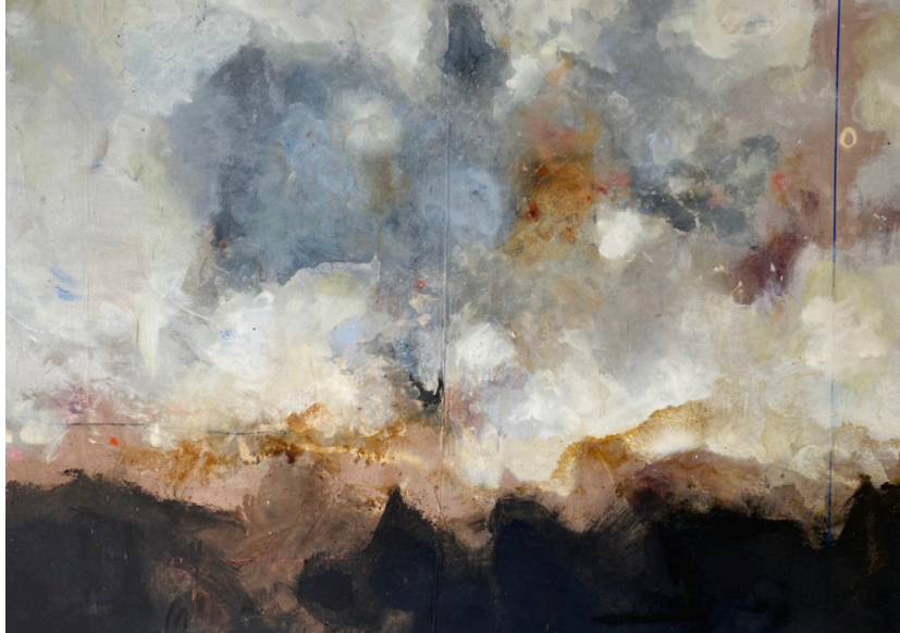
Alexis Alary, 30A - L'éclaireur, Huile sur toile, 135 x 190 cm

Alexis Alary , est un artiste peintre, au travers de son œuvre, il convoque une énergie qui jaillit, qui éclabousse.