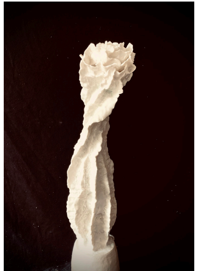
Idylla, 14 Y - Délicatement, Porcelaine, Dimensions © Idylla