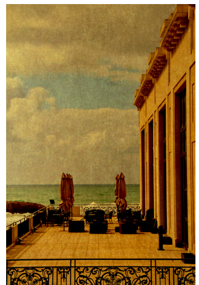
Rodolphe Martinez, Le Casino de Biarritz en Hiver , 2019

Si l'or fascine comme valeur absolue ou refuge, comme preuve de richesse ou de sophistication, c'est surtout son intemporalité qui m'intéresse dans cette série. Une matière qui n'oxyde pas le temps mai qui l'étire. L'une des propriétés de l'or est d'être ductile, c'est-à-dire de pouvoir être étiré sans rompre. C'est un travail sur le temps plus que sur l'or lui-même.