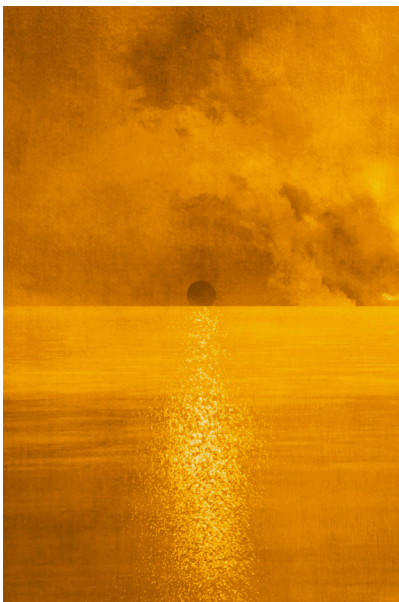
Rodolphe Martinez, Soleil Or , 2019 © RM

Vernissage public - Vendredi 21 Avril 2023 (18h30 - 21h30)