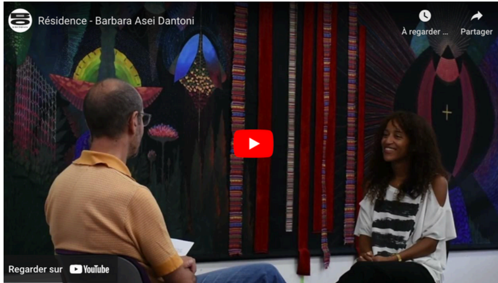
© Le Bel Ordinaire - Résidence - Barbara Asei Dantoni

“En tant qu’artiste, l’entremêlement de symboles et de récits liés à mes cultures hétérogènes, est à la source de mon travail de création. Cet intérêt me conduit souvent à l’exploration d’autres cultures, notamment celles des peuples autochtones d’Amérique, dont les histoires tragiques d’appropriation de terres et d’arrachements entrent en résonance avec les histoires de mes ancêtres.